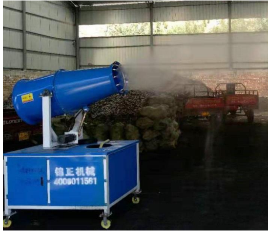
煤棚喷淋洒水装置