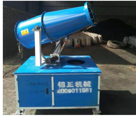
煤棚喷淋洒水装置